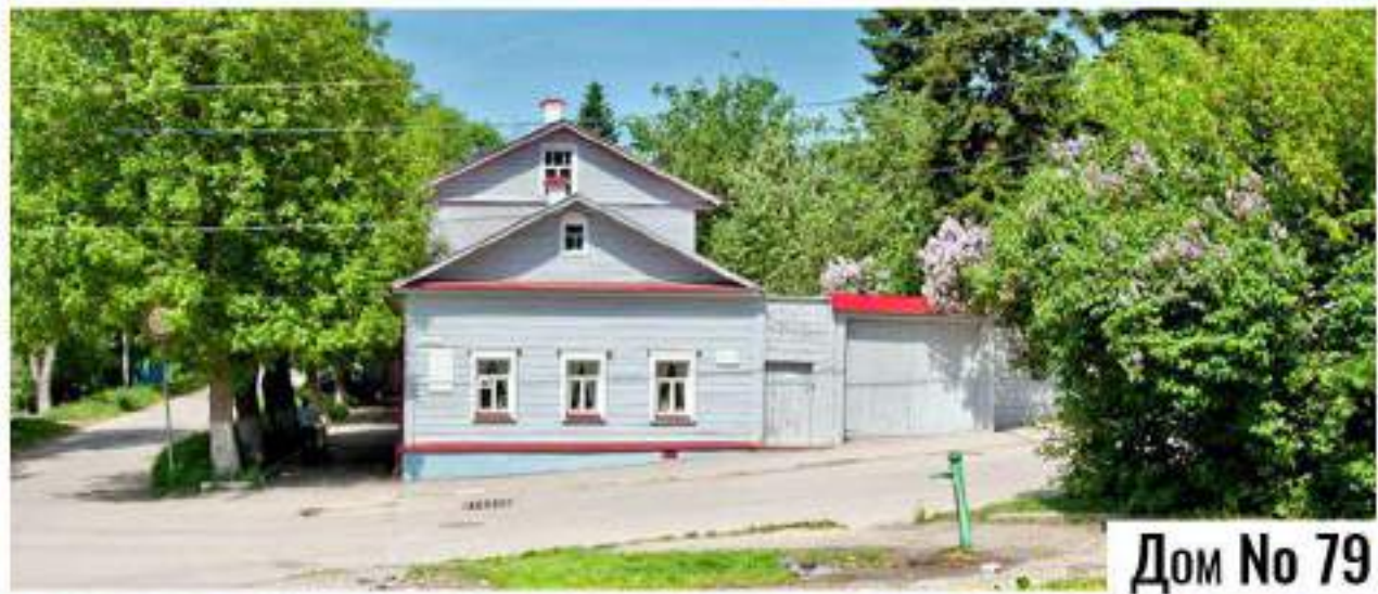
Дом No 79