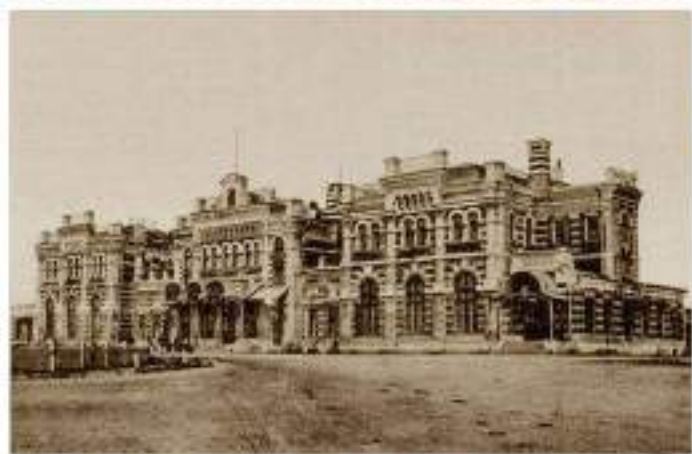
КАЛУЖСКИЙ ВОКЗАЛ ДАТА ПОСТРОЙКИ 1898 г.

КАЛУГА - один из старейших городов русской земли. Ему более 640 лет. Датой основания города принято считать 1371 год, когда он впервые упоминается в грамоте литовского князя Ольгерда. Расположенная на юго-западной окраине Московского государства, Калужская земля на протяжении ряда столетий служила его торговым постом. В первой половине XVIII века Калуга становится одним из крупнейших торговых центров страны. В 1719 году была организована Калужская провинция, а в 1776 году - Калужская губерния. Это поспособствовало дальнейшему экономическому и культурному развитию города. До сих пор в городе сохранились сооружения, которые являются памятниками архитектуры прошлых веков.