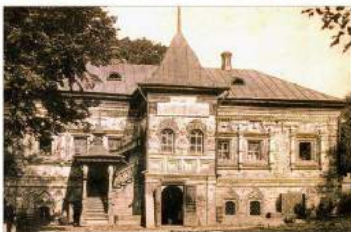
ПАЛАТЫ К.И. КОРОБОВА ДАТА ЗАСТРОЙКИ - ВТОРАЯ ПОЛОВИНА 17 ВЕКА