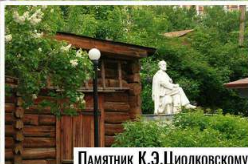
Памятник К.Э. Циолковскому