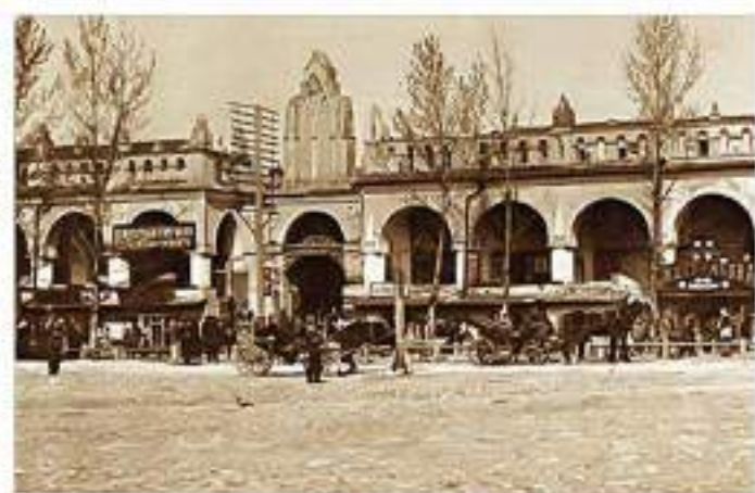
ПЛОЩАДЬ СТАРЫЙ ТОРГ НАЧАЛО ЗАСТРОЙКИ С 1788 г.