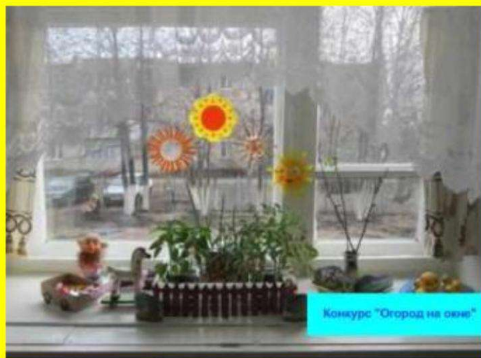
Конкурс "Огород на окне"