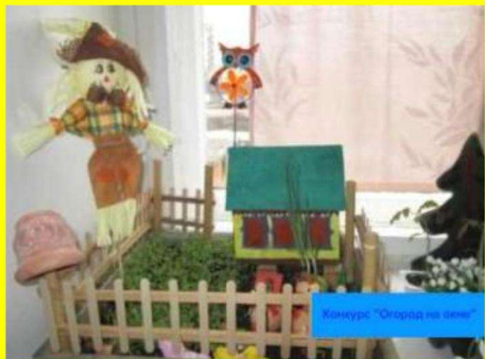
Конкурс "Огород на окне"