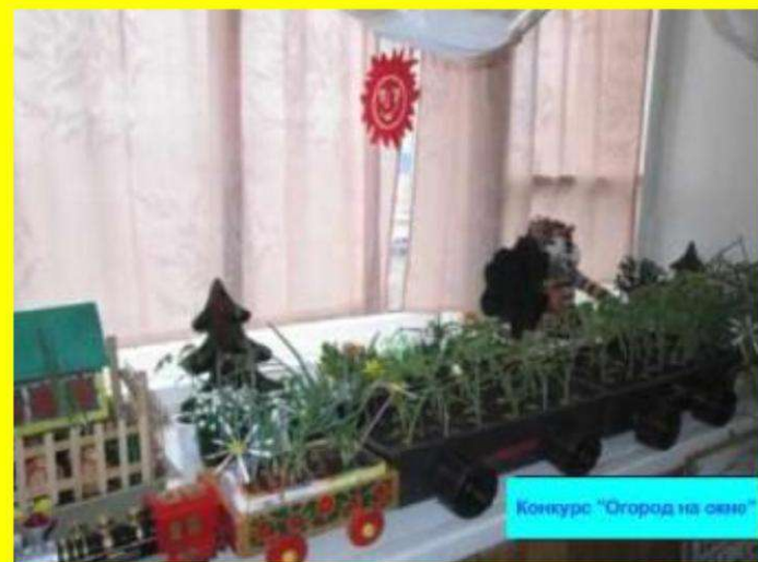
Конкурс "Огород на окне"