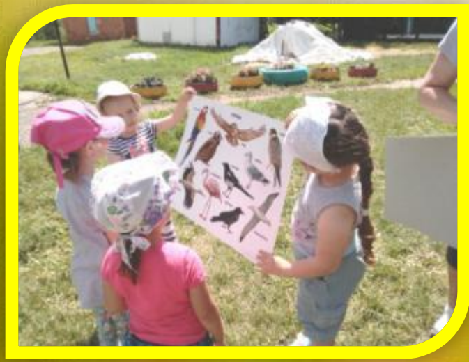
Развлечение на экологической тропе